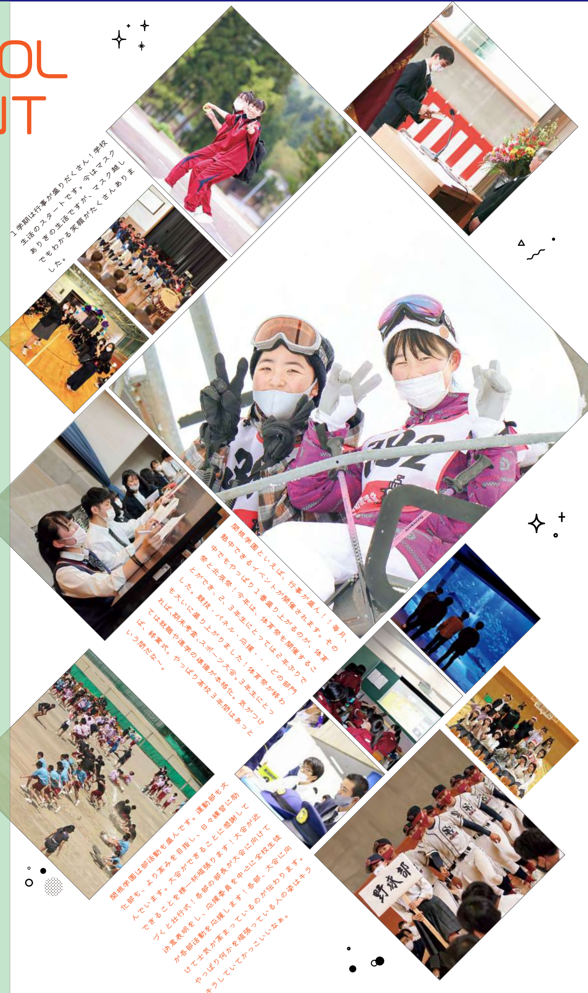
「1学期は行事が盛りだくさん! 学校生活のスタートです。今はマスクでもわかる笑顔がたくさんありました。」