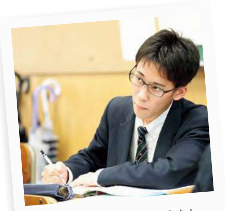
授業中、しっかり集中しています!