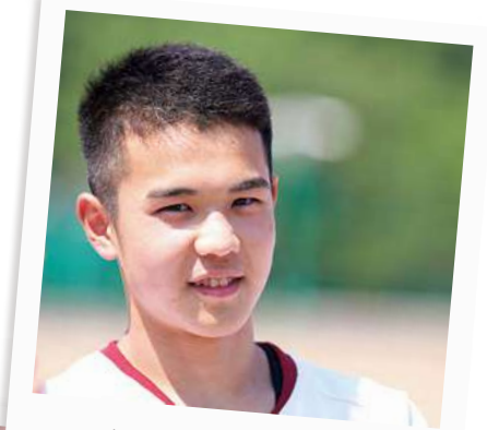
体育祭前のブロック集会 応援優勝目指します!