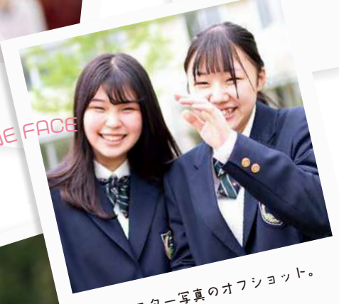
ポスター写真のオフショット。